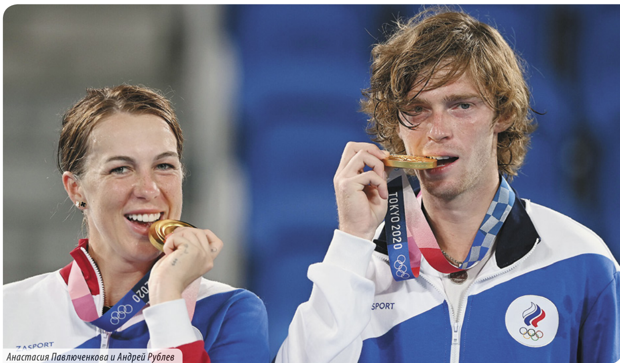
Анастасия Павлюченкова и Андрей Рублев

1 августа в Токио в финале олимпийских состязаний в смешанном разряде Анастасия Павлюченкова и Андрей Рублев победили Елену Веснину и Аслана Карацева. Это позволило сборной России выиграть олимпийский теннисный турнир в командном зачете.