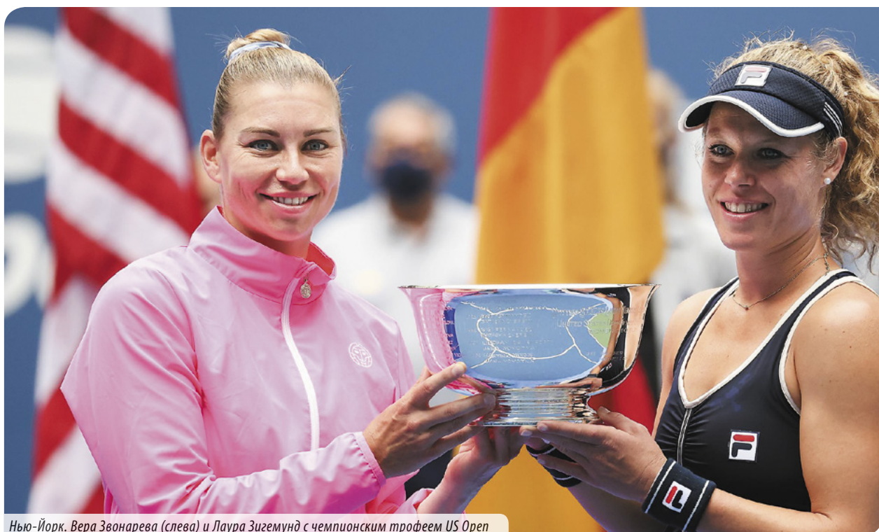
Нью-Йорк. Вера Звонарева (слева) и Лаура Зигемунд с чемпионским трофеем US Open