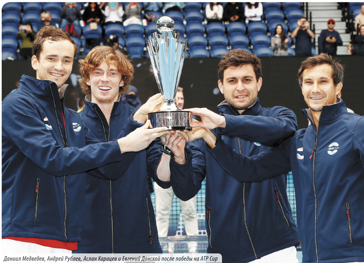
Даниил Медведев, Андрей Рублев, Аслан Каратев и Евгений Донской после победы на ATP Cup

– Смотря что под этим словом подразумевать. Честно говоря, больше всего я рассчитывал на женскую пару, в которой Елена Веснина и Вероника Кудерметова отдали бронзу с нескольких матчболов. Для Весниной, кстати, лишней оказалась нагрузка в одиночке, где ей не стоило выкладываться. Что касается микста, то там победный пасьянс сложился из большого количества нюансов. Ведь заранее мы