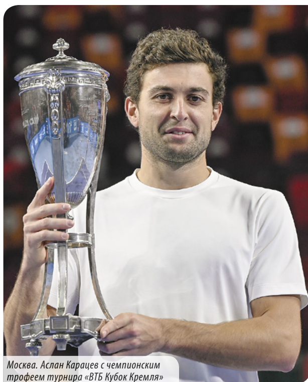
Москва. Аслан Карацев с чемпионским трофеем турнира «ВТБ Кубок Кремля»