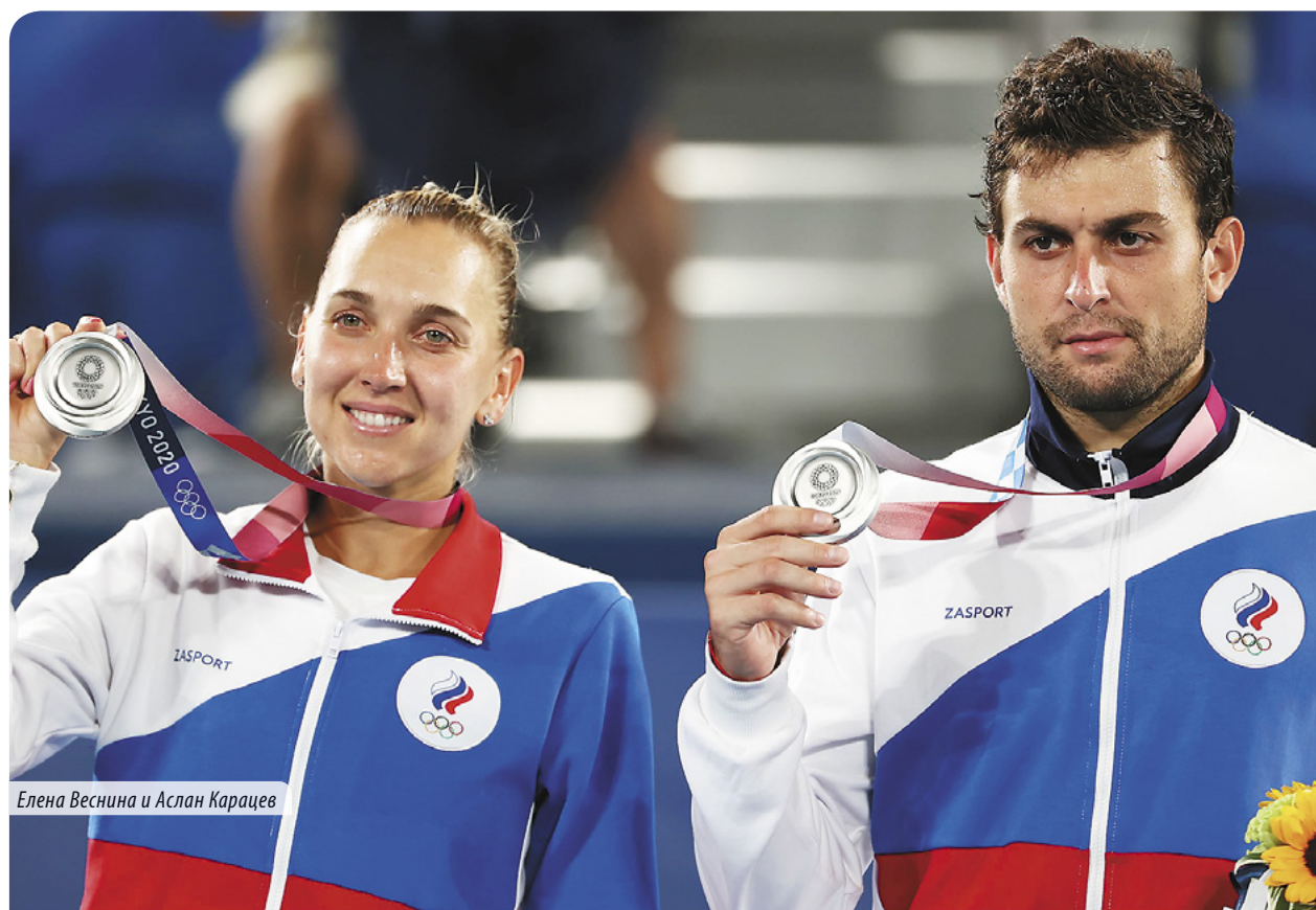
Елена Веснина и Аслан Карацев

И дело, конечно, не только в удаче. Такого роскошного финиша теннисного турнира почти наверняка не было бы, если бы не тренировочный сбор, который ФТР после Уимблдона при содействии члена Совета Федерации Александра Верховского организовала для игроков в Южно-Сахалинске с целью акклиматизации. По словам Шамиля Тарпищева, именно там был заложен фундамент наших успехов в Токио. Ведь нынешний олимпийский теннисный турнир, точнее, первая его половина в прямом смысле слова оказалась самой жаркой в истории Игр. Токийские 35 градусов в тени при высокой влажности воздуха превратились в настоящий ад даже для тех, кому доводилось сталкиваться с подобным экстримом в Мельбурне на Открытом чемпионате Австралии. Лишь после настойчивых просьб в ITF нескольких спортсменов, в том числе Новака Джоковича и Даниила Медведева, и Александр Зверев, начало матчей с первой половины дня было перенесено на вторую.