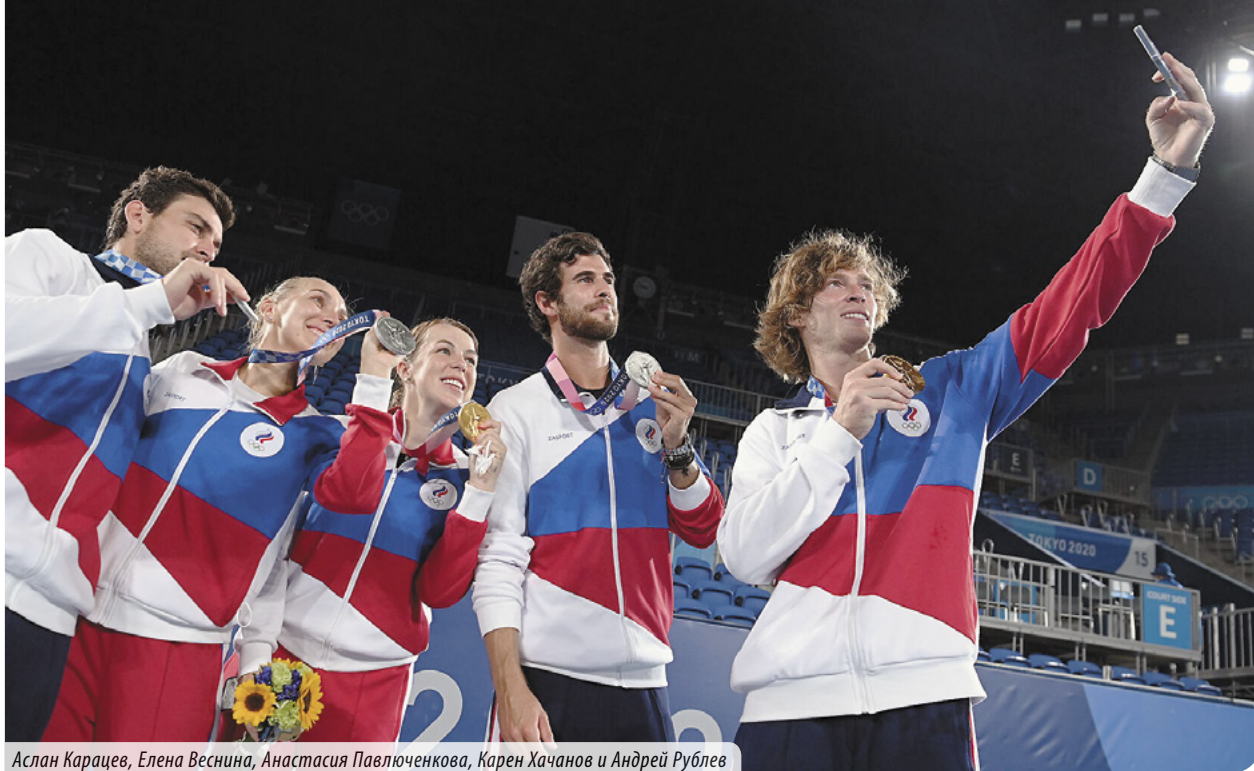
Аслан Карацев, Елена Веснина, Анастасия Павлюченкова, Карен Хачанов и Андрей Рублев

наигрывали только одну пару – в составе Весниной и Аслана Карацева, которые, кстати, сразу же выбили посеянных первыми французов. А другой, победный дуэт Анастасии Павлюченковой и Андрея Рублева по большому счету образовался случайно. Я спросил Рублева, с кем он хочет играть. Андрей ответил, что ему все равно – мол, Кудерметова получше подает, а Павлюченкова в целом сильнее пару играет. В конце концов за двадцать минут до истечения срока заявки мы решили выставить с ним Павлюченкову и угадали, так как, после этого, проиграв в четвертьфинале одиночки Белинде Бенчич, она сэкономила силы. Рублеву ранние поражения в одиночке и паре тоже пошли в плюс, поскольку они с Павлюченковой превзошли соперников в свежести. Ну и отчасти, конечно, немного повезло. Ведь все четыре матча они вытащили на решающих тай-брейках, причем в двух отыгрывали матчболы. Этот мировой рекорд наверняка в обозримом будущем никому побить не удастся.