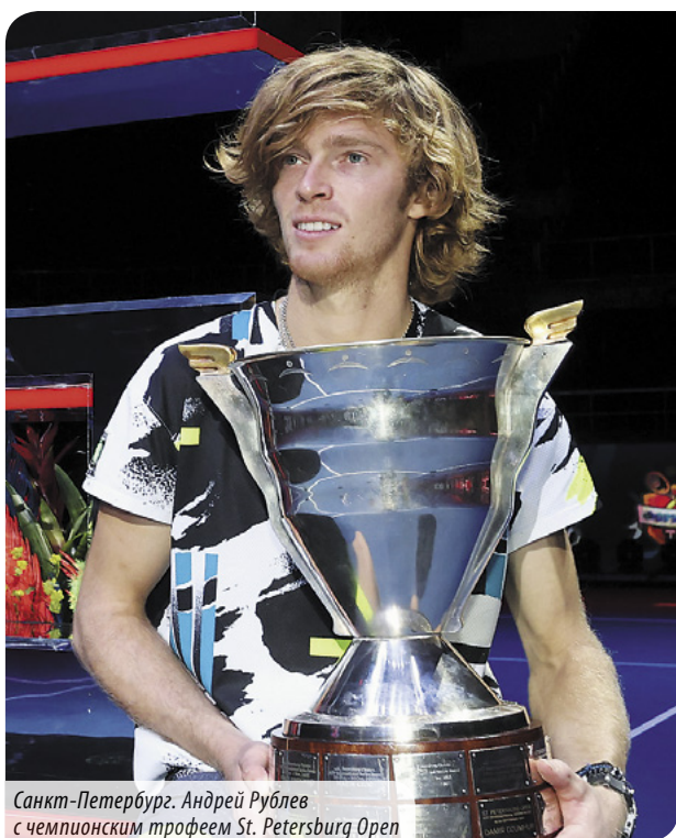
Санкт-Петербург. Андрей Рублев с чемпионским трофеем St. Petersburg Open