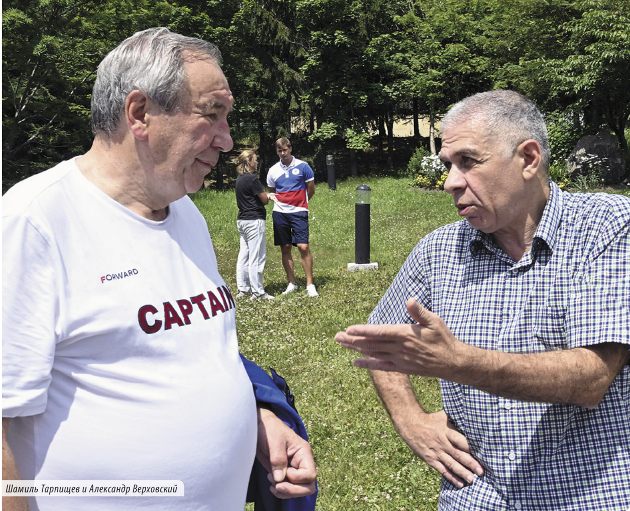
Шамиль Тарпищев и Александр Верховский

олимпийского турнира, в отличие от многих соперников, наши спортсмены оказались в идеальной форме. Поэтому сейчас мы говорим искренние слова благодарности в адрес губернатора Сахалинской области Валерия Лимаренко и его первого заместителя Сергея Байдакова.