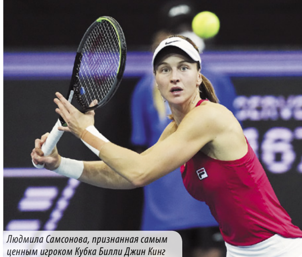
Людмила Самсонова, признанная самым ценным игроком Кубка Билли Джин Кинг