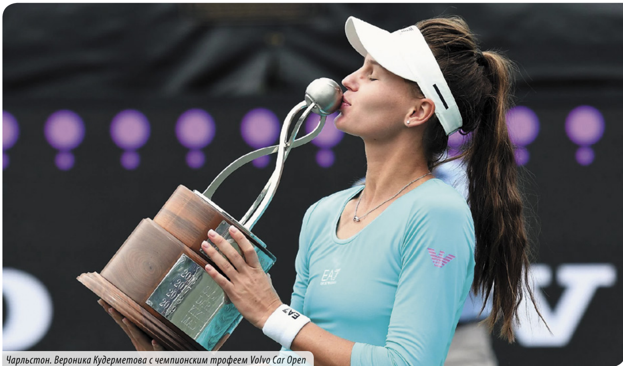
Чарльстон. Вероника Кудерметова с чемпионским трофеем Volvo Car Open