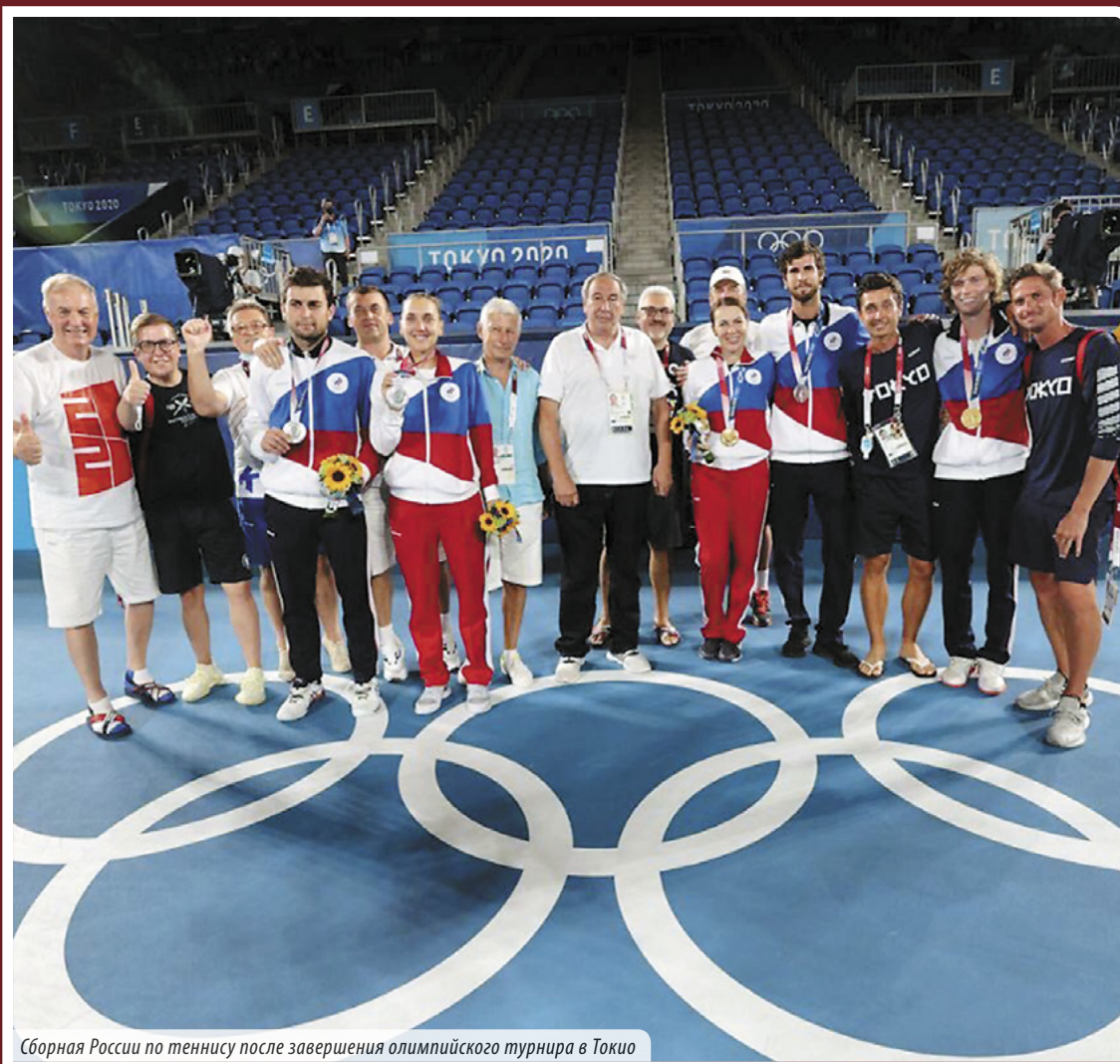
Сборная России по теннису после завершения олимпийского турнира в Токио