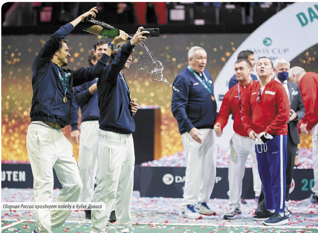
Сборная России празднует победу в Кубке Дэвиса